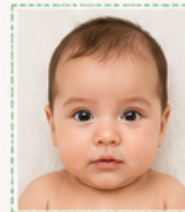
ROSTRO ENCUADRADO Bien centrado, ocupa la mayor parte del encuadre.